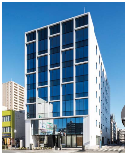
全130席の(新)相模原カスタマーセンターが入る、きらぼし銀行相模原センタービル。新センターは現場の女性スタッフのこだわりが詰まっている