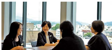
いつでも利用できる会議・研修室や景色の良いミーティングスペース