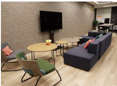
ボックス席、ソファ席、スタンディングデスクなど、状況に応じて使い分け可能な多様なミーティングスペースを設置