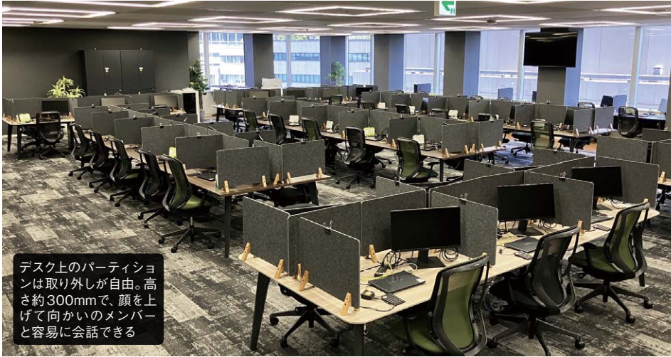
デスク上のパーティションは取り外しが自由。高さ約300mmで、顔を上げて向かいのメンバーと容易に会話できる