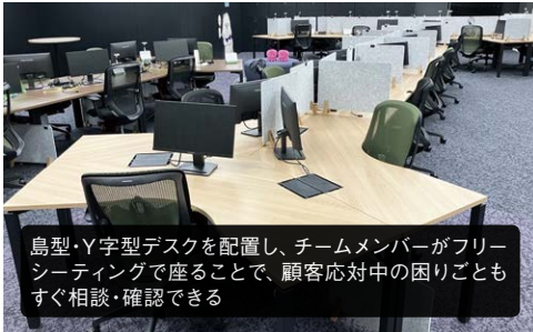
鳥型・Y字型デスクを配置し、チームメンバーがフリーシーティングで座ることで、顧客対応中の困りごとにもすぐ相談・確認できる