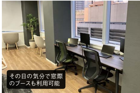
その日の気分で窓際のブースも利用可能

英オクトパスエナジーのクラーケンシステムを導入し、チーム制を採用。十数名からなるチームが丸となって顧客の問題解決にあたるため、コミュニケーションを重視したオフィス設計を行う