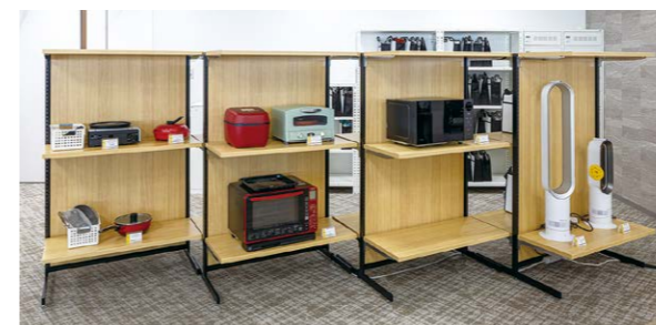
ジャパネットならではの実機コーナー。問い合わせ商品をすぐ手に取れる環境で、視覚情報や触感・操作感などをより丁寧に伝える