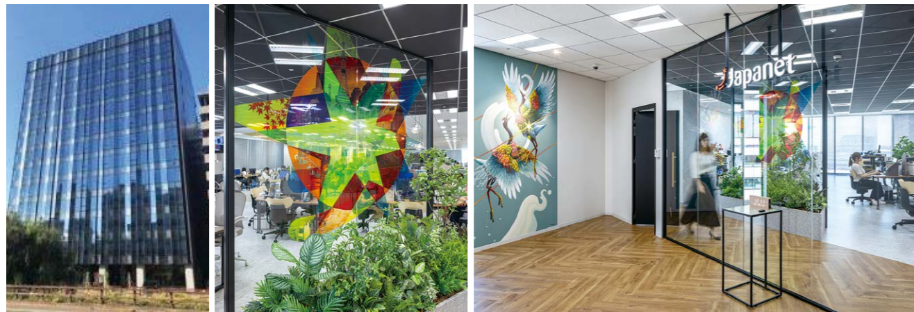
BCP対策の強化と、温泉宿泊予約事業を行うゆこゆこのグループ会社化に伴い札幌オフィスを新設。明るい光が差し込む開放的な空間がコミュニケーションの活性化にもつながる