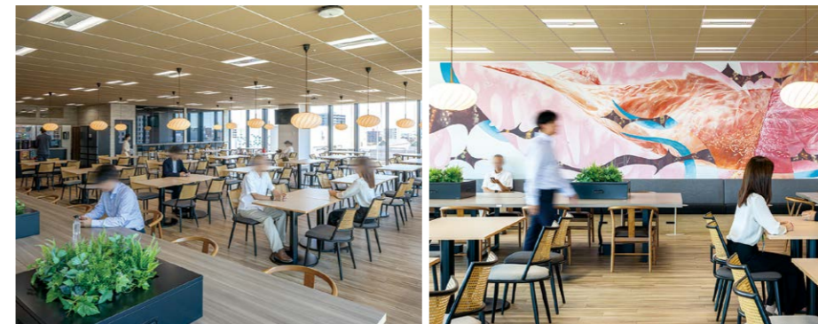
従業員同士の交流を深める、広々とした休憩室。ジャパネット×ゆこゆこ×札幌の融合を表現した大型アートも