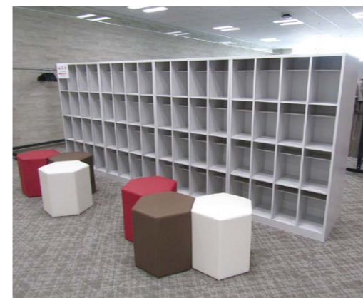
寒冷地対策として長靴も入るロングシューズボックスを設置