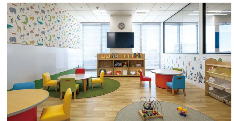
子育てと仕事を両立できる安心の託児所を完備。子どもの様子が見られる大きなガラス窓も設置