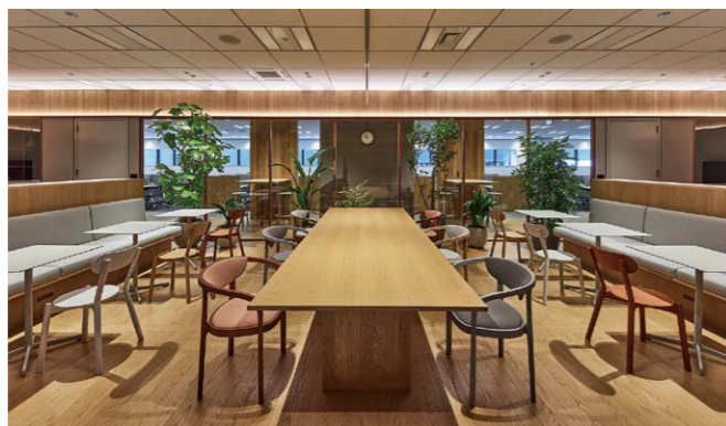
コンセプトは“つながり”。従業員の心身に寄り添い、最高のパフォーマンスを引き出す工夫がちりばめられている。エントランスからロッカー、リフレッシュルーム、ワークスペースへの導線もその一例