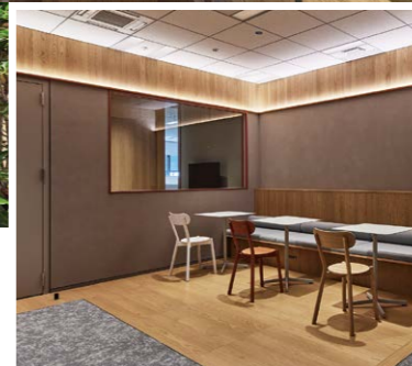
パントリーカウンター。カフェブレイクなどでコミュニケーションが生まれる場所に