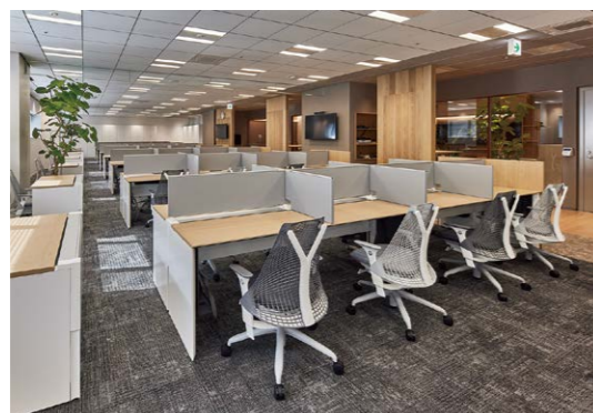
ワークスペース。ストレスなく人の行き来ができ、管理者がサポートできる通路幅を確保