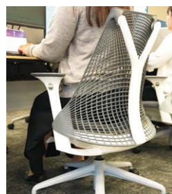
従業員自ら選んだワークチェアは長時間座っても体に優しい