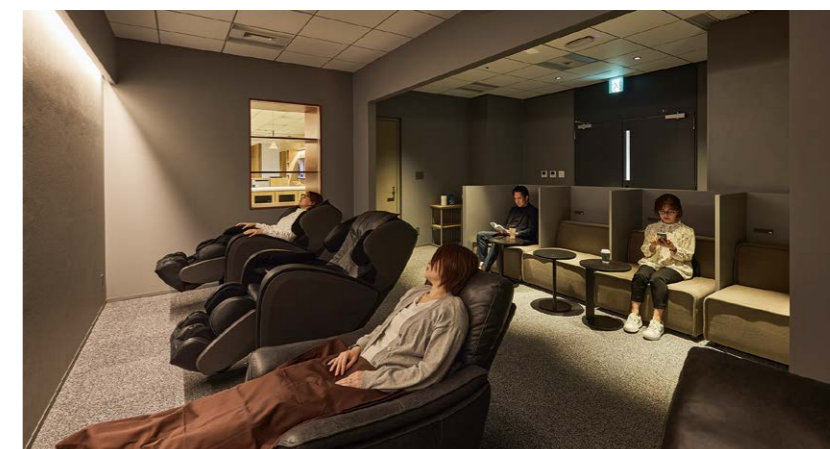
従業員のウェルビーイングを追求したメディテーションルーム。半個室のソファやマッサージチェアを完備