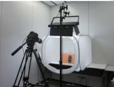
動画を使ったサポートを実現する「スタジオ」