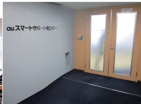
シンプルながら高級感漂うエントランス