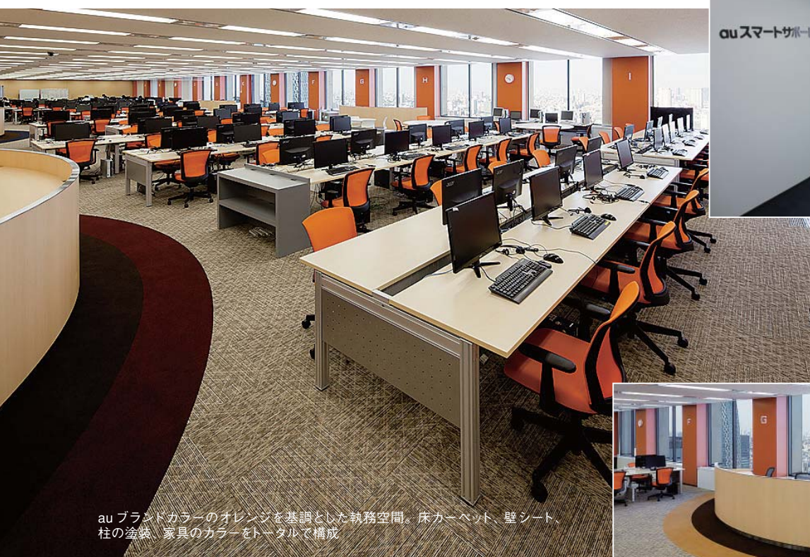
auブランドカラーのオレンジを基調とした執務空間。床カーペット、壁シート、柱の塗装、家具のカラーをトータルで構成