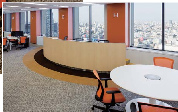
オペレータを一目で確認できるSVブース