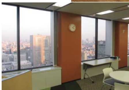
高層階から新宿の高層ビル街を眺望できる