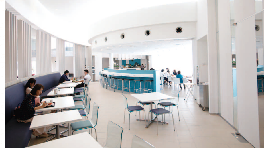
港町をコンセプトとしたデリ・レストラン。世界各国・ご当地の作りたての日替わりメニューを提供している