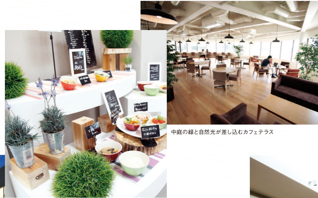
中庭の緑と自然光が差し込むカフェテラス