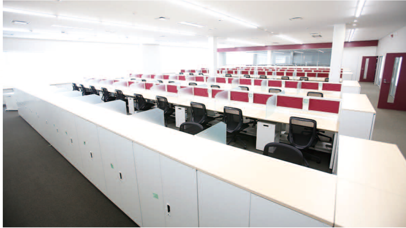
オペレーション席は、シンプルで見渡しのきく形態にしている